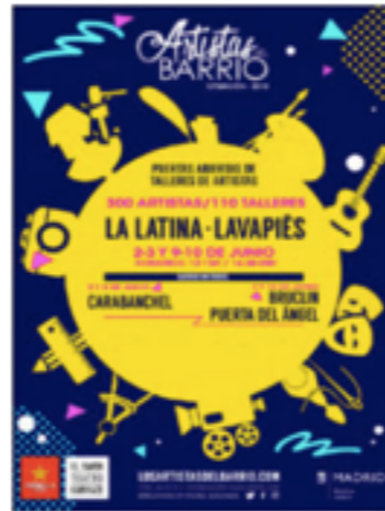
Los Artistas del Barrio 2018 | La Latina, Lavapiés, Puerta del Ángel y Carabanchel | 02, 03, 09 y 10/06/2018 | Cartel