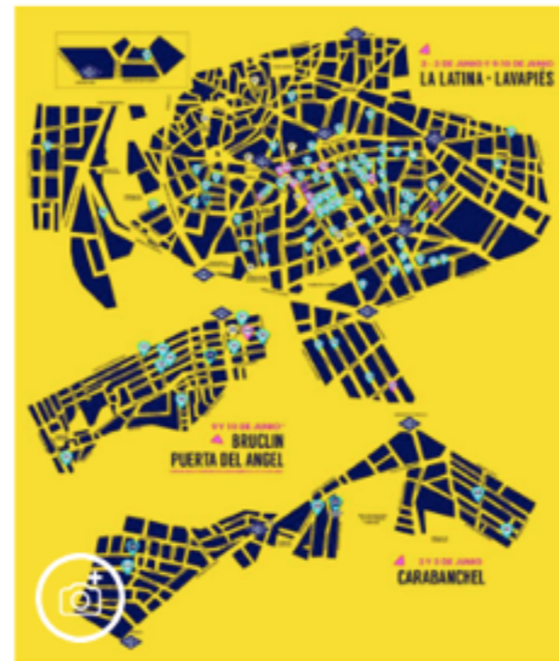
Mapa de la actividad.

El país https://elpais.com/ ccaa/ 2018/06/01/ madrid/ 1527863992_593 435.html